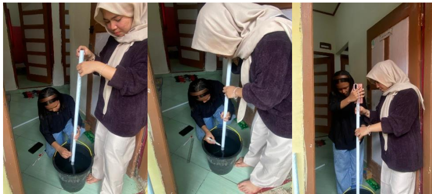
Gambar 4. Mengukur, memberi tanda dan mengambil data Pipa Besar

Untuk membuat alat praktikum ini, kita memerlukan beberapa peralatan sederhana: Inti dari percobaan ini adalah paralon (pipa kecil dan besar) yang akan berfungsi sebagai saluran udara. Paralon ini akan kita letakkan di dalam ember yang sudah diisi dengan air. Air ini bertindak sebagai medium untuk mengatur panjang kolom udara. Untuk menghasilkan getaran suara, kita akan menggunakan ponsel pintar (handphone) sebagai sumber bunyi. Sementara itu, penggaris dibutuhkan untuk mengukur secara tepat panjang kolom udara yang terbentuk di dalam paralon. Terakhir, kita juga memerlukan spidol untuk memberi tanda pada pipa paralon di bagian yang tidak tercelup air, agar pengukuran menjadi lebih mudah dan jelas.