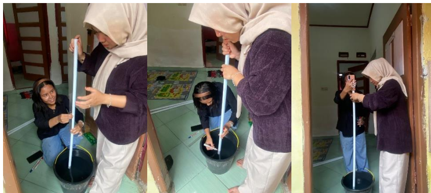
Gambar 3. Mengukur, memberi tanda dan mengambil data pada Pipa Kecil