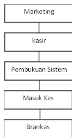
Gambar 1 :Bagan Alir Dokumen Sistem Akuntansi Penerimaan Kas dari Unit Usaha KSPPS Bina Umat Madani

Pada 1.1 menyajikan bagan alir dokumen sistem akuntansi penerimaan kas dari unit usaha KSPPS Bina Umat Madani.