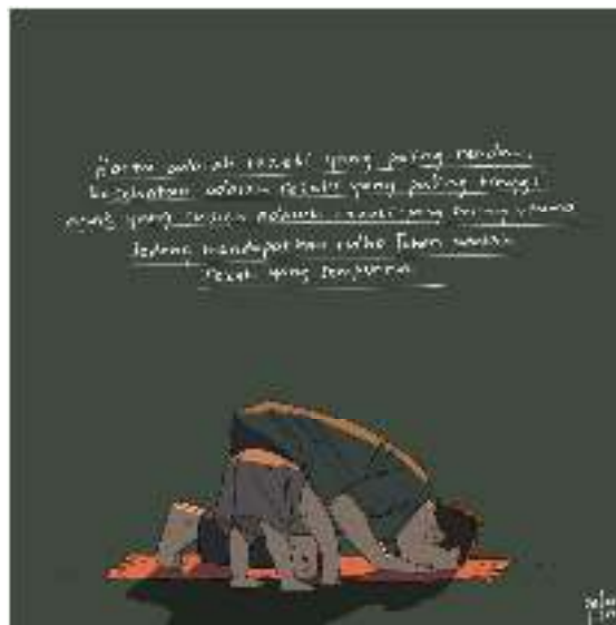
Pemikiran dari syaikh Muhammad Mutawalli Asy-Sya' rawi