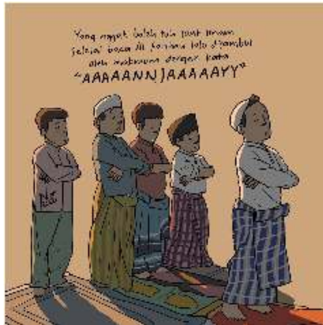
Jangan Anjay ya adek adek, tapi AMIIN.....

NP : ANJAY PALING SERIUS - Sal Priadi & Nadin Amizah