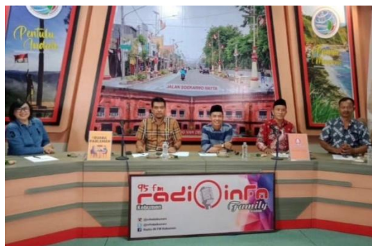
Gambar 1. Live talkshow bersama DPRD Kebumen