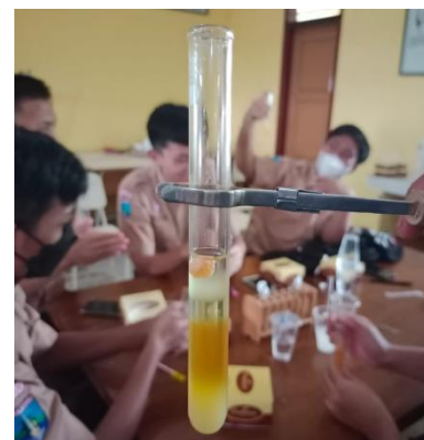
Gambar 1. Hasil isolasi DNA

Berdasarkan Gambar 2, diketahui bahwa sebagian besar keterampilan metakognitif siswa sebesar 50% dalam kategori berkembang sangat baik dan 36% berkembang baik, dan 13% mulai berkembang. Meskipun sebagian besar keterampilan metakognitif siswa menunjukkan hasil yang positif masih terdapat siswa yang kategori keterampilan metakognitifnya belum begitu berkembang sebanyak 1%.