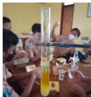
Gambar 1. Hasil isolasi DNA

Berdasarkan diagram 1, diketahui bahwa sebagian besar keterampilan metakognitif siswa sebesar 50% dalam kategori berkembang sangat baik dan 36% berkembang baik, dan 13% mulai berkembang. Meskipun sebagian besar keterampilan metakognitif siswa menunjukkan hasil yang positif masih terdapat siswa yang kategori keterampilan metakognitifnya belum begitu berkembang sebanyak 1%.