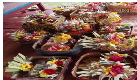
Gambar 3. Banten Canang Sari

Banten merupakan media untuk memvisualisasikan ajaran-ajaran Hindu. Sebagai media untuk menyampaikan Sradha dan Bhakti pada ke Mahakuasaan Hyang Widhi Wasa Banten merupakan bentuk budaya sacral keagamaan Hindu yang berwujud lokal, namun didalamnya terdapat nilai universal global. Menurut Suryani (2002), bebantenan merupakan pelajaran atau alat konsentrasi pikiran untuk memuja Ida Sang Hyang Widhi, dan menunjukkan pula adanya unsure kebudayaan antara lain susunan dalam bentuk daya seni dan keindahan. Banten dipergunakan sebagai sarana untuk menyampaikan rasa cinta, bhakti dan kasih. Banten juga diaartikan sebagai wali. Kata wali berarti wakil. Banten itu dalam suatu upacara sebagai wakil untuk berhubungan dengan yang dipuja atau dimuliyakan (Arwati, 2002). Banten yang digunakan dalam setiap ritual upacara adat bali masyarakat kecamatan Labuhan Maringgai yaitu Banten Pejati, Banten Daksine, Banten Canang Sari, Banten Banten Sagehan dan Banten kewangen (Sutara, 2016).