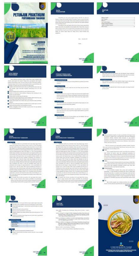
Gambar 2. Desain Petunjuk Praktikum Pertumbuhan Tanaman

Dalam konteks penyusunan penuntun praktikum, aspek visual seperti gambar, ilustrasi, dan warna cover juga menjadi pertimbangan penting untuk meningkatkan kualitas panduan (Mutoharoh et al., 2022). Selain itu, pembaruan informasi dalam panduan praktikum juga diperlukan agar peserta didik dapat lebih aktif dalam memecahkan masalah (Ulfa et al., 2022).