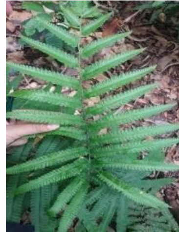
Gambar 6. Pakis Kapur ( Pneumatopteris pennigera ). (Dokumentasi Anggita, 2023)

Tumbuhan paku spesies Pneumatopteris pennigera banyak ditemukan ditempat yang lembab, memiliki rimpang yang tebal, hidup merayap atau membentuk batang yang tegak dengan pelepah yang menggerombol secara rapat. Daun tumbuhan paku spesies ini memiliki ciri-ciri bentuk menyirip, melengkung dengan ujung daun runcing (Andari, 2022).