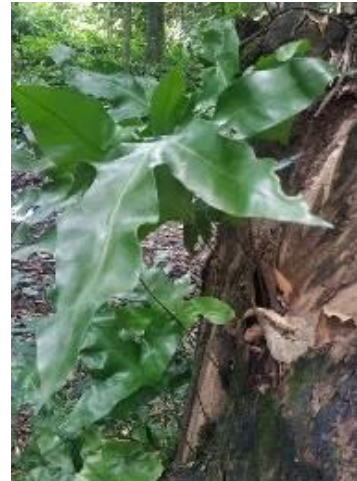
Gambar 4. Paku Wangi ( Phymatosorus scolopendria ).

Paku Wangi mempunyai bentuk akar serabut yang menjalar. Batang rimpang menjalar, bersisik kecil, daun berwarna hijau, bentuk daun menjari. Phymatosorus scolopendria termasuk kedalam famili Polypodiaceae yang hidup secara epifit (Pulungan, 2019).