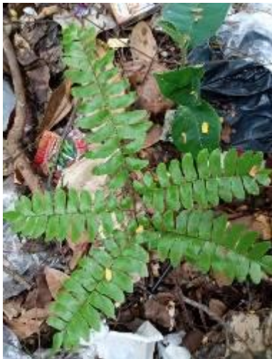
Gambar 3. Paku Suplir Kedondong ( Adiantum trapeziforme ). (Dokumentasi Fauziah, 2023)

Adiantum trapeziforme biasa dikenal dengan suplir kedondong, merupakan family dari Adiantaceae. Adiantum trapeziforme memiliki bentuk daun membulat atau oval. Batang Adiantum trapeziforme berupa rimpang berwarna hitam teruntai halus. Spora sebagai alat reproduksi berukuran kecil (Nasution, 2018). Paku Suplir menyukai daerah yang lembab dengan sedikit sinar matahari, itulah kenapa Adiantum trapeziforme ditemukan pada lantai hutan Hutan Kota Linara dan menjadi tempat yang tepat untuk pertumbuhan Adiantum trapeziforme . (Lestari, 2011).