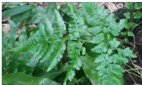
Gambar 8. Pakis Daun ( Gymnocarpiun dyropteris ).

Pakis daun memiliki akar serabut dengan batang rimpang kehitaman. Daunnya berwarna hijau, sebagian besar berbentuk segitiga dengan tepi bersirip dan ujung meruncing. Sorus terdapat di bawah permukaan daun (Batta, 2022). Gymnocarpiun dyropteris termasuk kedalam famili Dryopteridaceae, ditemukan pada lantai Hutan Kota Linara.