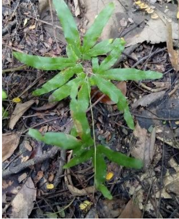
Gambar 5. Pakis Pemanjat ( Lygodium palmatum ).

menjari, ujung runcing dan tepi rata. Batang tipis berwarna coklat disertai percabangan dikotom. Setiap sisi cabang mempunyai 2 anak daun (Tjitrosoepomo, 2009).