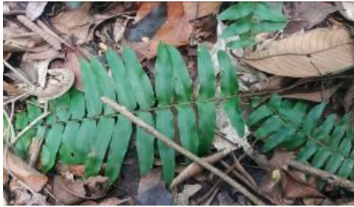
Gambar 7. Paku Sepat ( Nephrolepis cordifolia ).