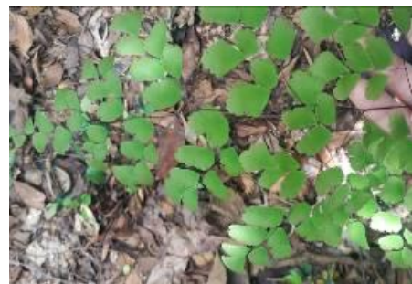
Gambar 9. Suplir Kelor ( Adiantum raddianum )

Adiantum raddianum termasuk kedalam famili Pteridaceae. Memiliki ukuran daun yang relative kecil dan agak membulat. Entalnya kecil, berbentuk segitiga serta menjuntai. Adiantum raddianum lebih suka tumbuh di area pegunungan yang sejuk, dan tumbuh liar di tepi parit berbatu atau tebing. Adiantum raddianum ditemukan di atas bebatuan dan bekas bangunan pada Hutan Kota Linara (Sastrapradja, 1980).