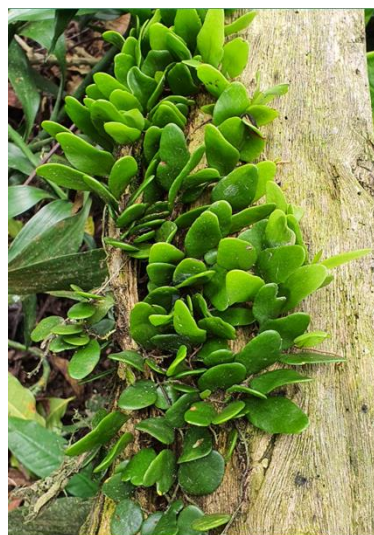
Gambar 2. Paku Sisik Naga ( Pyrrrosia piloselloides ).

Paku sisik naga ( Pyrrrosia piloselloides ) termasuk kedalam famili Polypodiaceae yang merupakan salah satu jenis tumbuhan paku yang dapat ditemukan tumbuh merambat di pepohonan. Walaupun tumbuh merambat pada pohon inangnya, paku sisik naga dapat membuat makanannya sendiri dengan cara fotosintesis. Berikut klasifikasi paku sisik naga ( Pyrrrosia piloselloides ).