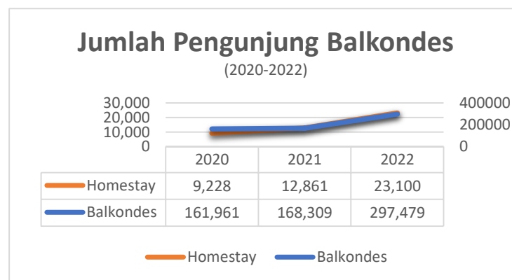
Gambar 1 Kantor Pengelola Balai Ekonomi Desa & Homestay

Candi Borobudur menjadi potensi pariwisata Kabupaten Magelang yang sangat luar biasa, karena destinasi super prioritas nasional yang dapat meningkatkan dan menstabilkan ekonomi masyarakat di sekitar objek wisata di sekitar Candi Borobudur. Hal itu selaras dengan tujuan pembangunan berkelanjutan (SDGs) yang menjadi titik referensi dan pedoman untuk tercapainya agenda 2030, pembangunan berkelanjutan dengan koneksi lokal dan regionalnya dianggap sebagai kendaraan yang berpotensi tinggi untuk mempraktikkan pembangunan berkelanjutan (Sari & Setyorini, 2020).