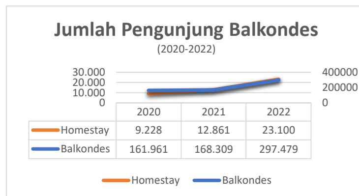
Gambar 1 Kantor Pengelola Balai Ekonomi Desa & Homestay

Candi Borobudur menjadi salah potensi pariwisata di Kabupaten Magelang yang sangat luar biasa, karena destinasi wisata nasional yang dapat meningkatkan dan menstabilkan ekonomi masyarakat di sekitar objek wisata di sekitar Candi Borobudur. Hal itu selaras dengan tujuan pembangunan berkelanjutan (SDGs) yang menjadi titik referensi dan pedoman untuk tercapainya agenda 2030. Namun nyatanya dengan adanya wisata Candi Borobudur belum bisa meningkatkan perekonomian warga sekitar Candi Borobudur yang tersebar di 20 desa. Dengan kondisi tersebut mendorong pemerintah untuk membangun BALKONDES (Balai Ekonomi Desa) yang di dukung oleh beberapa CSR ( Corporate Social Responsibility ) dengan harapan oleh adanya balkondes tersebut dapat membuka peluang kerja bagi masyarakat sekitar yang secara tidak langsung juga akan berdampak pada peningkatan perekonomian masyarakat sekitar, karena balkondes merupakan salah satu pariwisata berkelanjutan, Pengunjung balkondes per tahun 2020-2022 mengalami kenaikan yang tertera pada grafik berikut.