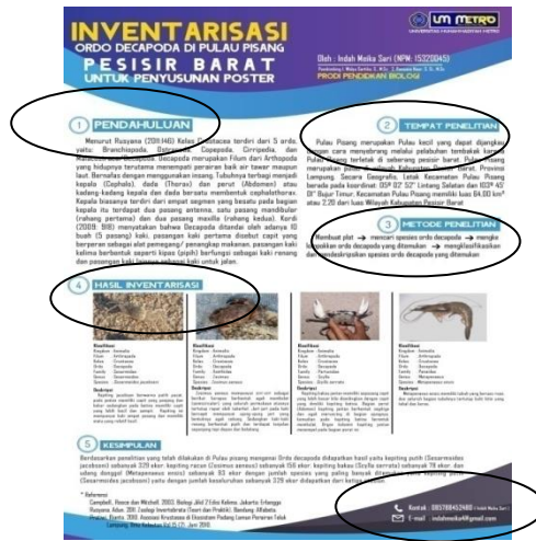
Poster Sesudah Revisi

Poster dikatakan valid apabila berada pada kategori 61-80%, sedangkan sangat valid apabila berada pada presentase 81-100%. Berdasarkan kategori presentase penilaian yang dijadikan sebagai indikator untuk mengetahui kelayakan dari poster yang telah dikembangkan, dapat diketahui bahwa kualitas dari poster setelah dilakukan perhitungan memiliki hasil validasi berada pada rentang 81-100 yaitu sangat valid. Riduwan dan Akdon (2015) produk poster yang telah dikembangkan ini dapat dikatakan layak untuk digunakan.