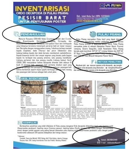
Poster Sebelum Revisi

saran dari produk poster yang dikembangkan: