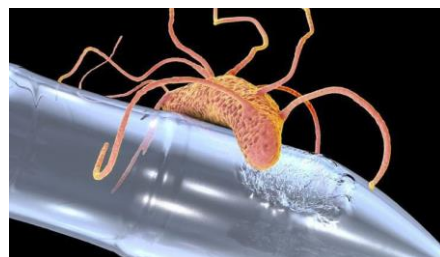
Gambar 3. Bakteri Ideonella sakaensis berada pada objek plastik.

Salah satu bakteri yang berperan dalam proses degradasi plastik adalah Ideonella sakaiensis . Bakteri ini termasuk dalam genus Ideonella , famili Comamonadaceae, serta kelas Betaproteobacteria (Kaur et al , 2023). I. sakaiensis memiliki kemampuan khusus untuk mensekresikan enzim PETase yang memungkinkan degradasi plastik jenis Polyethylene terephthalate (PET) menjadi senyawa yang lebih sederhana (Maity et al , 2021). Sebagai bakteri Gram-negatif, I. sakaiensis mampu memecah struktur plastik yang mengandung komponen kimia kompleks seperti PET. Menurut, bakteri ini memiliki karakteristik berbentuk koloni bulat dengan diameter sekitar 0,5–1 mm, memiliki alat gerak berupa flagela, serta dapat berwarna kuning atau tidak berwarna. Selain itu, berdasarkan penelitian, I. sakaiensis bersifat aerobik mesofilik, berbentuk batang lurus atau sedikit melengkung, tidak membentuk spora, dan memiliki aktivitas positif terhadap katalase dan oksidase (Azizah, 2022).