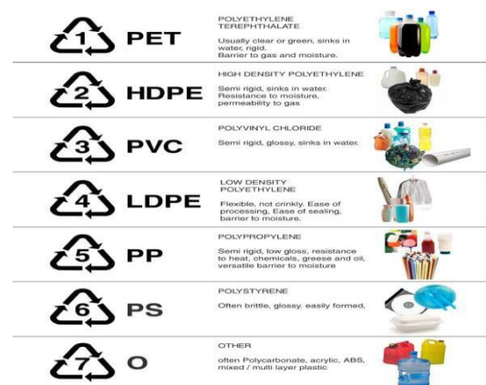
Gambar 1. Jenis-jenis kandungan plastik

Plastik dikenal memiliki daya tahan yang sangat tinggi dan sulit terurai secara alami. Plastik memiliki sifat yang resisten terhadap degradasi dan mampu bertahan dalam lingkungan selama bertahun-tahun tanpa mengalami perubahan signifikan. Plastik merupakan polimer sintetik berantai panjang yang sering digunakan untuk meningkatkan efisiensi dan daya tahan suatu produk (Indraswati, 2017). United Nations Environment Programme (UNEP) dalam Purnomo, 2021 mengklasifikasikan plastik menjadi enam jenis berdasarkan bahan pembuatannya, yaitu PET ( Polyethylene Terephthalate ), PP ( Polypropylene ), PVC ( Polyvinyl Chloride ), LDPE ( Low-Density Polyethylene ), HDPE ( High-Density Polyethylene ), dan PS ( Polystyrene ). Dari berbagai jenis plastik tersebut, PET menjadi perhatian utama dalam penelitian biodegradasi karena penggunaannya yang luas dalam kemasan dan limbahnya yang sulit terurai secara alami.