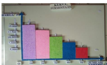
Gambar 3. Tampilan Tahapan Kurva Permintaan Pada Alat Peraga IPS