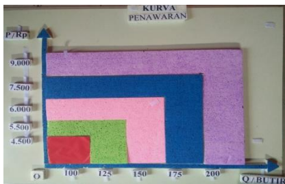
Gambar 6. Tampilan Tahapan Kurva Penawaran Pada Alat Peraga IPS