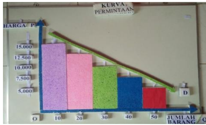
Gambar 4. Tampilan Tahap Akhir Kurva Permintaan Pada Alat Peraga IPS