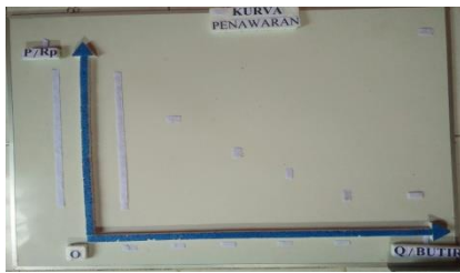
Gambar 5. Tampilan Awal Kurva Penawaran Pada Alat Peraga IPS