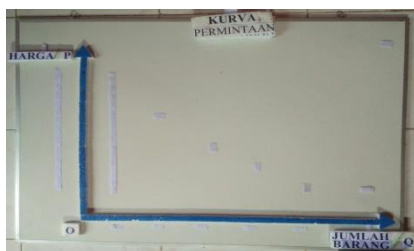
Gambar 2. Tampilan Awal Kurva Permintaan Pada Alat Peraga IPS

Berdasarkan hasil rekapitulasi data yang telah dilakukan, alat peraga IPS sudah layak dan baik digunakan, namun revisi produk tetap peneliti lakukan sesuai dengan saran dan masukan yang telah diberikan oleh ahli media pembelajaran maupun ahli materi pembelajaran. Perbaikan ini dilakukan agar alat peraga IPS hasil pengembangan ini lebih layak dan lebih baik lagi dalam penggunaannya dan layak digunakan pada saat proses pembelajaran. Wujud akhir produk media pembelajaran alat peraga IPS dapat dilihat pada gambar berikut ini.