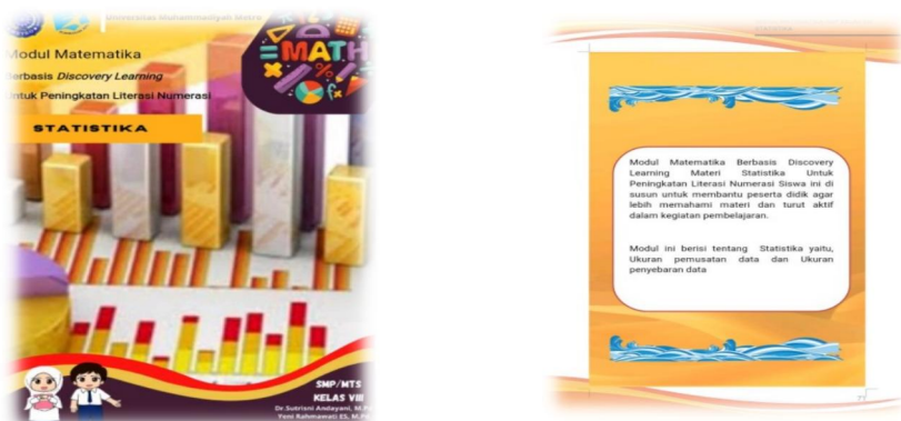
Gambar 2. Sampul depan dan sampul belakang

Modul ini menggunakan jenis huruf Times New Roman dengan ukuran huruf 11. Pada pendahuluan modul berisi halaman depan, judul modul, kata pengantar, daftar isi, petunjuk penggunaan modul, peta konsep, Kompetensi inti dan kompetensi dasar, tujuan pembelajaran, dan tokoh inspiratif statistika. Modul ini berisikan materi statistika, contoh soal lengkap dengan pembahasannya, penyelesaian contoh soal menggunakan langkah-langkah discovery learning yaitu stimulus, identifikasi masalah, pengumpulan data, pengolahan data, verifikasi, dan kesimpulan, selain menggunakan langkah-langkah discovery learning penyelesaian soal menggunakan langkah-langkah literasi numerasi yaitu memecahkan masalah, analisis, dan menarik kesimpulan. Pada modul terdapat latihan soal yang dapat diselesaikan oleh peserta didik. Bagian akhir modul berisikan rangkuman dan uji kompetensi dan sudah dilengkapi dengan kunci jawaban, daftar pustaka, catatan, dan biografi penulis.