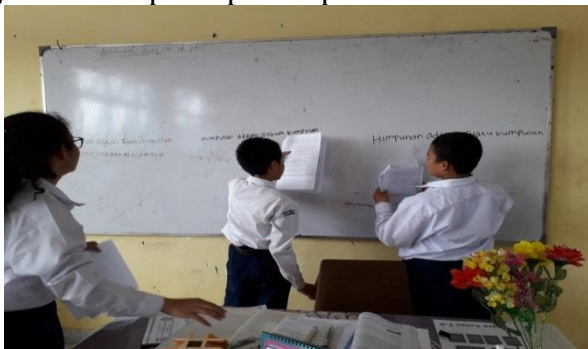
Gambar 2: Presenstasi Peserta didik

dan himpunan semesta. Pada gambar di bawah ini merupakan gambaran aktivitas pelaksanaan penyajian hasil kerja peserta didik/mempresentasikan hasil kerjanya di depan kelas mengenai konsep himpunan pada Gambar 2 berikut: