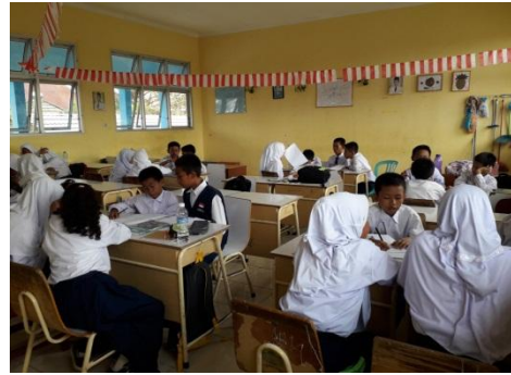
Gambar 3: Aktivitas Peserta didik Dalam Kelompok