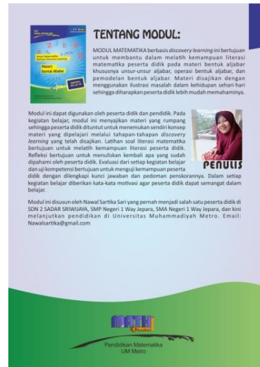
(b) Sampul Belakang