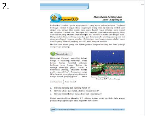
Gambar 7. Memahami Keliling Dalam Bahan Ajar

Media pembelajaran matematika berbasis android memberikan penjelasan yang menarik disertai gerakan pada segiempat sesuai dengan penjelasan materi.