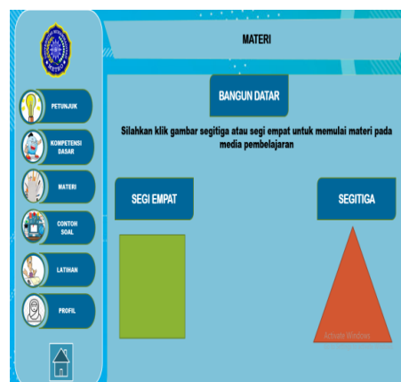
Gambar 4. Pendahuluan Dalam Media Pembelajaran Matematika

Bahan ajar yang digunakan sekolah berisikan penjelasan dan contoh mengenai konsep dasar segi empat dan segitiga