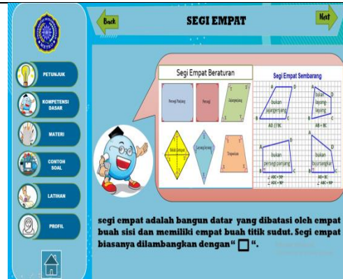
Gambar 6. Isi Media Pembelajaran Matematika

Pada bahan ajar yang digunakan sekolah memberikan penjelasan yang monoton