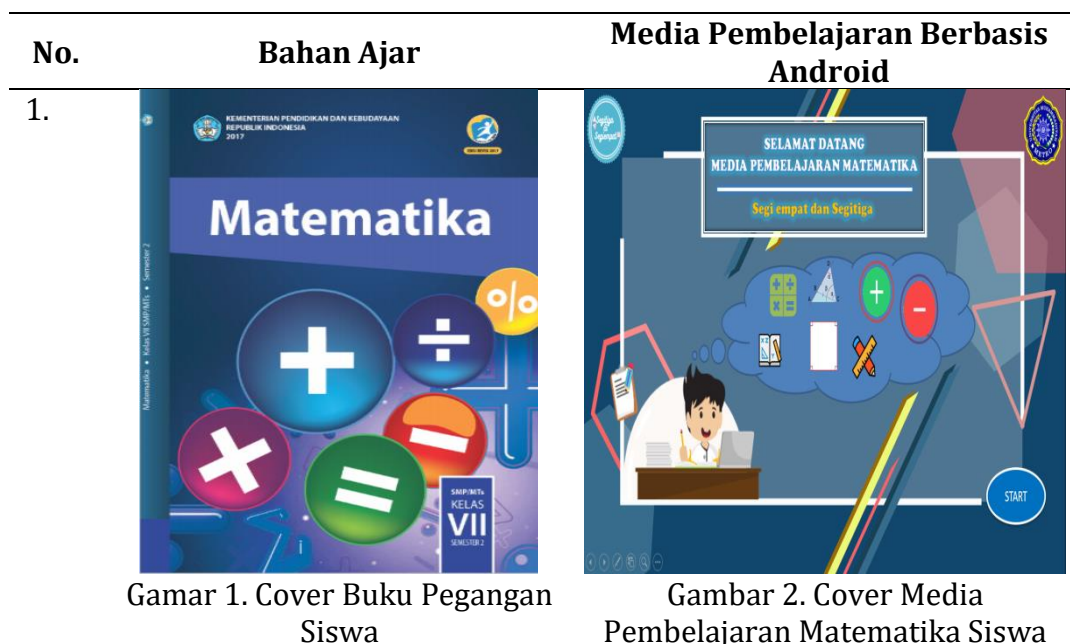
Tabel 5. Penyajian Bahan Ajar dan Media Pembelajaran Matematika Berbasis Android yang Dikembangkan

Bahan ajar yang dipakai di sekolah belum ada penjelasan secara rinci yang memudahkan Media pembelajaran matematika berbasis android yang memberikan penjelasan yang lebih mudah