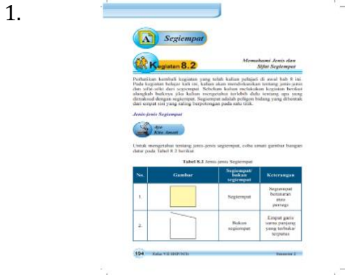
Gambar 5. Isi Materi Segiempat Dan Segitiga

Pada bahan ajar yang digunakan sekolah memberikan penjelasan yang monoton