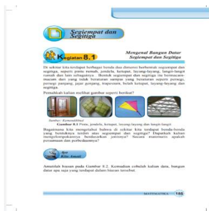
Gambar 3. Pendahuluan Dalam Buku Siswa

Bahan ajar yang digunakan sekolah berisikan penjelasan dan contoh mengenai konsep dasar segi empat dan segitiga