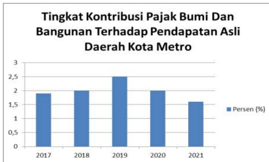
Gambar 4. Grafik Rasio Kontribusi Pajak Bumi Dan Bangunan Kota Metro. (Sumber : Olah Data Realisasi Pajak Bumi Dan Bangunan Dan Realisasi Pendapatan Asli Daerah Kota Metro)

(Sumber : Olah Data Realisasi Pajak Bumi Dan Bangunan Dan Realisasi Pendapatan Asli Daerah Kota Metro)