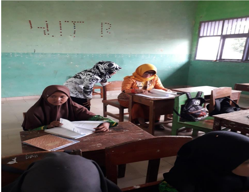
Gambar 2: Penulis melakukan pengamatan pembelajaran guru dalam menerapkan model kooperatif

yang bertindak sebagai guru model. Penerapan satu model pembelajaran kooperatif sebetulnya hanya perlu waktu satu minggu, tetapi Latihan penguasaan sintaksis menurut masing-masing model butuh waktu hampir 3 minggu. Sehingga diperlukan waktu 4 minggu untuk melaksanakan satu model pembelajaran kooperatif bagi seorang guru di satu sekolah.