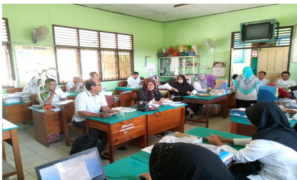
Gambar 1. Penulis menyampaikan sintak model pembelajaran kooperatif

didiskusikan tentang segala hal baik teknik pelaksanaan maupun persiapan yang diperlukan, kemudian guru diminta melakukan simulasi dalam kelompok-kelompok kecil di antara guru tersebut. Kepala sekolah sebagai peneliti membagikan transkrip sintaksis pembelajaran dari 13 model pembelajaran kooperatif sehingga masing-masing guru dapat mengoreksi kesalahan sintaksis ketika simulasi dilakukan. Selanjutnya setiap guru diberi tugas untuk mendemonstrasikan satu jenis kooperatif sedangkan beberapa teman mengamatinya. Reviu dilakukan setelah tampilan dengan menukar jenis kooperatifnya.