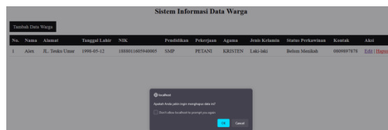
Gambar 5 Hapus data warga

Data warga di edit berdasarkan id_warga yang ada pada url, selanjutnya pada gambar 5 terdapat pop-up ketika tombol hapus di klik, berikut ini tampilan hapus data warga.