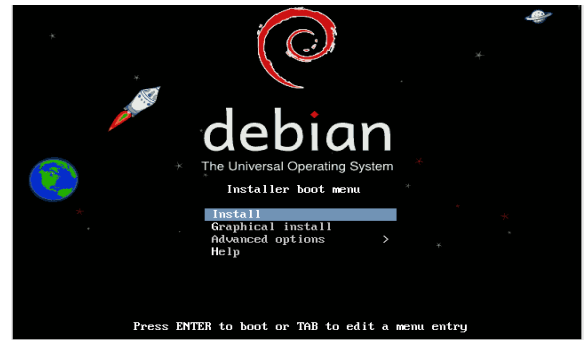
Gambar 3. Memulai Instalasi Debian 6

Peneliti menggunakan Operating System Debian versi 6.