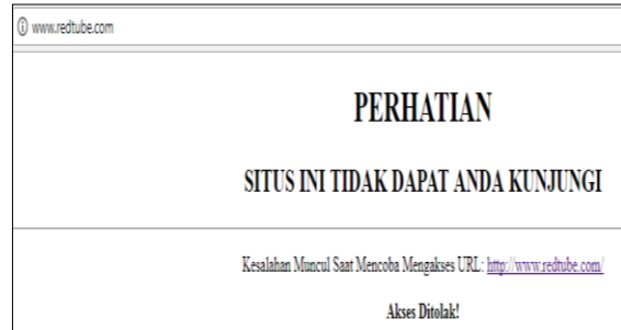
Gambar 9. Pengujian Sukses Blokir Situs Berkonten Pornografi

Akses domain pornografi misalkan www.redtube.com , maka akan domain tersebut diblokir oleh proxy squid/ proxy server (tidak diizinkan di akses).