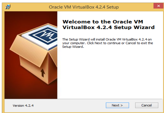
Gambar 2. Tampilan Instalasi App Virtualbox

Peneliti menggunakan Virtual Box versi 4.2.4.