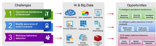
Gambar 2. Peluang yang dibawa oleh kecerdasan buatan untuk mengatasi tantangan Blockchain

mengidentifikasi ekstrusi prospektif [13]. Selain evaluasi reflektif data Blockchain, diskusi teoritis diperlukan untuk meramalkan manifestasi reaksi balik Blockchain. Berbeda dengan inspeksi demonstratif dan kreatif, penyajian konvensional dapat mereplikasi dan mengembangkan fabric Blockchain untuk meningkatkan konsistensi Blockchain.