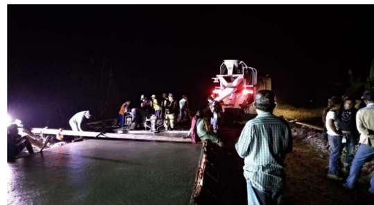
Gambar. 3 Pelaksanaan pengecoran rigid pavement dilakukan secara lembur (malam hari) sebagai strategi mitigasi keterlambatan waktu.