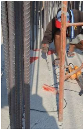
Gambar 6. Pembersihan lubang