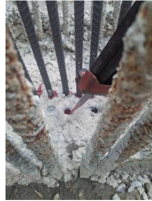
Gambar 7. Injeksi resin

Resin diinjeksikan ke dalam lubang yang sudah dibersihkan, penyuntikan resin dimulai dari ujung terdalam lubang dengan ditarik perlahan ke arah luar lubang menggunakan nozzle extension panjang 112,5 mm. Prosedur injeksi mengisi lubang dari bawah ke atas untuk menghindari rongga udara yang dapat mengurangi daya ikat.