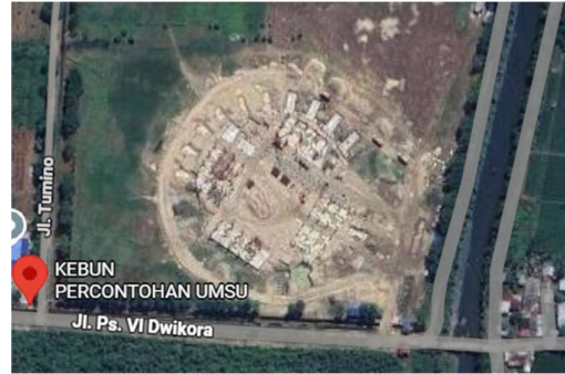
Gambar 2. Petunjuk Lokasi Penelitian

Pembangunan Gedung Auditorium Berkemajuan Universitas Muhammadiyah Sumatera Utara (UMSU), yang terletak di Jl. Dwi Kora, Psr VI, Desa Saentis, Kec. Percut Sei Tuan, Kab. Deli Serdang, Sumatera Utara. Penelitian ini dilakukan selama masa kerja praktik, yaitu pada periode yang sama dengan pelaksanaan pekerjaan pemasangan sambungan chemical anchor di lapangan.