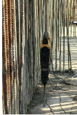
Gambar 4. Bor diameter 25 mm

Adapun standar spesifikasi teknik chemical anchor yang digunakan pada proyek pembangunan Gedung Auditorium UMSU yang sesuai dengan standar spesifikasi penggunaan produk dapat dilihat pada Tabel 1.