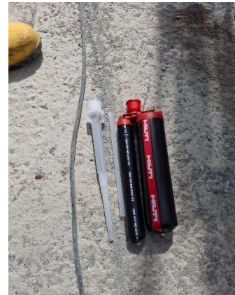
Gambar 3. Hilti HIT-RE 500 V3

Produk yang digunakan adalah Hilti HIT-RE 500 V3, sebuah sistem ankur kimia berbasis resin epoksi yang diinjeksikan menggunakan cartridge dua komponen dengan mixing nozzle . Pemilihan produk ini didasarkan pada ketersediaan sertifikasi ETA ( European Technical Assessment ) No.11/0493 yang mengakui kapasitas ankurnya pada berbagai kondisi beton.