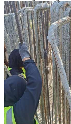
Gambar 8. Pemasangan tulangan Sumber: Dokumentasi magang, 2026

Setelah lubang terisi cairan resin, tulangan Ø 22 dimasukan kedalam dengan cara diputar searah jarum jam.