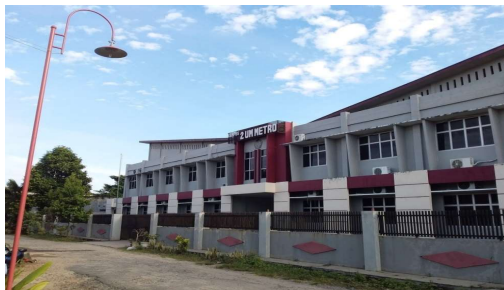
Gambar 1. Lokasi Penelitian Fakultas Teknik Universitas Muhammadiyah Metro

Penelitian dilakukan di Laboratorium Fakultas Teknik Sipil Universitas Muhammadiyah Metro.