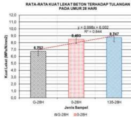
Gambar 3 Grafik Kuat Lekat Beton Terhadap Tulangan Umur 28 Hari