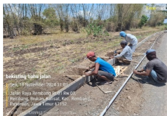
Gambar Bekisting Bahu Jalan

2. Pengecoran menggunakan truk mixer yang mengangkut beton dengan mutu K-250 sebelum beton dituang pada area bahu jalan yang sudah bekisting di beri lapis plastik sebagai lapisan pelindung, agar air dalam beton tidak meresap ke tanah dan mutu beton tetap terjaga.