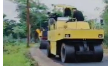
Gambar pemadatan AC-BC menggunakan tandem roller

Sebelum Melakukan Penghamparan Juga,Harus Disediakan Acuan Disamping Maupun Pada Finisher ,Berupa Balok Kayu Yang Telah Di Beri Tanda Untuk Mengukur Ketebalan Dari Hamparan Yang Telah Direncanakan. Dan juga sebelum penghamparan dilakukan penyemprotan pada lapis pondasi dengan aspal emulsi guna mengikat lapisan antara lapis pondasi dengan lapis ac-bc.