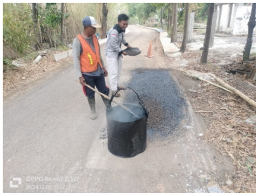
Gambar Penghamparan batu agregat

aspal curah berfungsi sebagai bahan pengikat utama yang mencampur agregat (batu pecah) dan membentuk lapisan perkerasan yang kokoh dan tahan lama. Aspal curah dipanaskan hingga mencapai suhu tertentu, kemudian dicampur dengan agregat untuk menghasilkan campuran lapen yang siap diaplikasikan ke jalan.