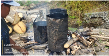
Gambar pembakaran aspal curah sebagai perakaat agregat

yang sama ,di lanjut dengan Penghamparan Batu Penutup Dengan Ukuran 0,5cm ,Dan Di Padatkan Menggunakan Mobil Tandem Roller Sebanyak 6 Kali.