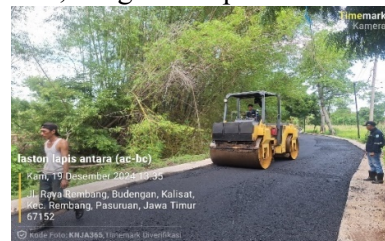
Gambar pemadatan dan finishing menggunakan pneumatic tandem roller

Tandem roller digunakan pada saat suhu campuran masih tinggi, umumnya antara 135–145°C, untuk memastikan campuran dapat dipadatkan secara efektif sebelum mengalami pendinginan yang signifikan. Pemadatan dengan tandem roller bertujuan untuk mengeluarkan udara dari campuran dan memulai penguncian awal antar agregat. Pada saat pemadatan pada kali ini dilakukan dengan menerapkan 6 kali lintasan , menggunakan pola zig-zag untuk meratakan pemadatan dengan maksimal, dengan kecepatan 3-5 km/jam .