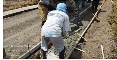
Pengecoran Bahu Jalan