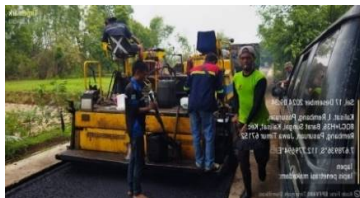
Gambar penghamparan aspal AC-BC menggunakan finisher