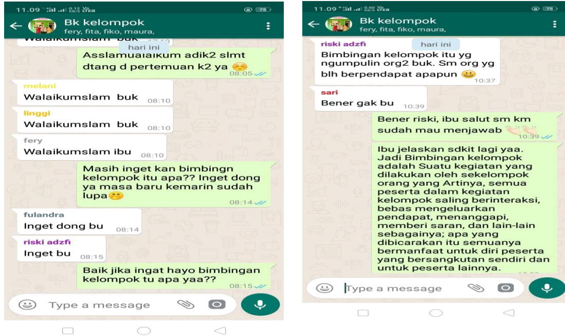
Gambar 2. Screenshot whatsapp grup pertemuan ke-2 layanan bimbingan kelompok