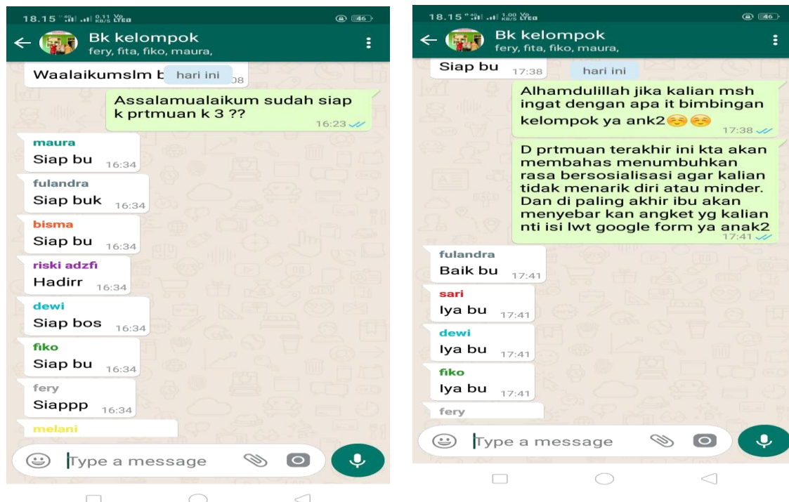
Gambar 3. Screenshot whatsapp grup pertemuan ke-3 layanan bimbingan kelompok