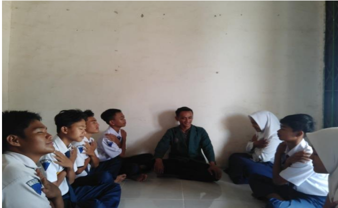
Gambar 3 Pemberian Layanan Pertemuan Pertama

Pada pertemuan pertama dilaksanakan pada hari minggu 04 juni 2023 pukul 09:30 sampai dengan selesai. Topik yang dibahas yakni mengenai kecemasan. Tujuannya agar peserta didik lebih memahami apa itu kecemasan. Berikut langkah langkah kegiatan yang dilaksanakan: