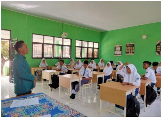
Gambar 4. Kegiatan Layanan Pertemuan ke Dua.

Pada pertemuan kedua dilaksanakan pada hari selasa 06 juni 2023 pukul 09:30 sampai dengan selesai. Topik yang dibahas yakni mengenai gejala kecemasan. Tujuan nya agar peserta didik lebih memahami gejala dari yang bersifat fisik atau yang bersifat perasan kecemasan. Berikut langkah langkah kegiatan yang dilaksanakan: