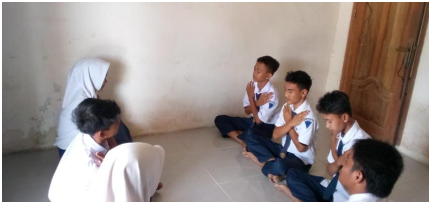
Gambar 5. Kegiatan Pertemuan ke Tiga Layanan Teknik Pelukan Kupu-kupu

Pada pertemuan ketiga dilaksanakan pada hari rabu 07 juni 2023 pukul 09:30 sampai dengan selesai. Topik yang dibahas yakni cara mengatasi kecemasan dengan teknik pelukan kupu kupu. Tujuan nya agar peserta didik lebih memahami gejala dari yang bersifat fisik atau yang bersifat perasan kecemasan. Berikut langkah langkah kegiatan yang dilaksanakan: