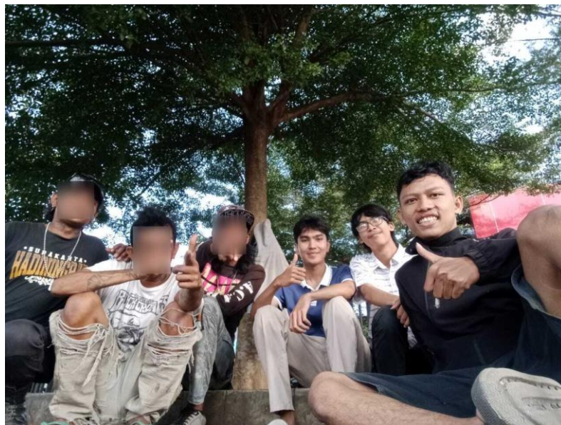
Gambar 1. Informan 1,2,3 dan peneliti

Informan 1 dalam penelitian ini merupakan remaja laki-laki dengan perkiraan usia sekitar 20 tahun. Secara fisik, informan 1 memiliki tinggi badan sekitar 165 cm dengan berat badan sekitar 55 kg. Gaya berpakaian yang dikenakan berupa kaos berwarna gelap dengan tulisan mencolok, dipadukan dengan celana panjang kasual. Informan ini juga mengenakan topi hitam serta aksesoris seperti kalung dan gelang, yang menunjukkan identitas sebagai bagian dari komunitas punk. Selain itu, terlihat adanya tato pada bagian tangan yang semakin memperkuat ciri khas visual informan. Dalam aktivitas sehari-hari, informan 1 lebih banyak menghabiskan waktu dengan berkumpul bersama anggota komunitas lain, mengamen, serta berinteraksi dengan masyarakat sekitar pasar.