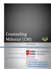
gambar 2. Program layanan