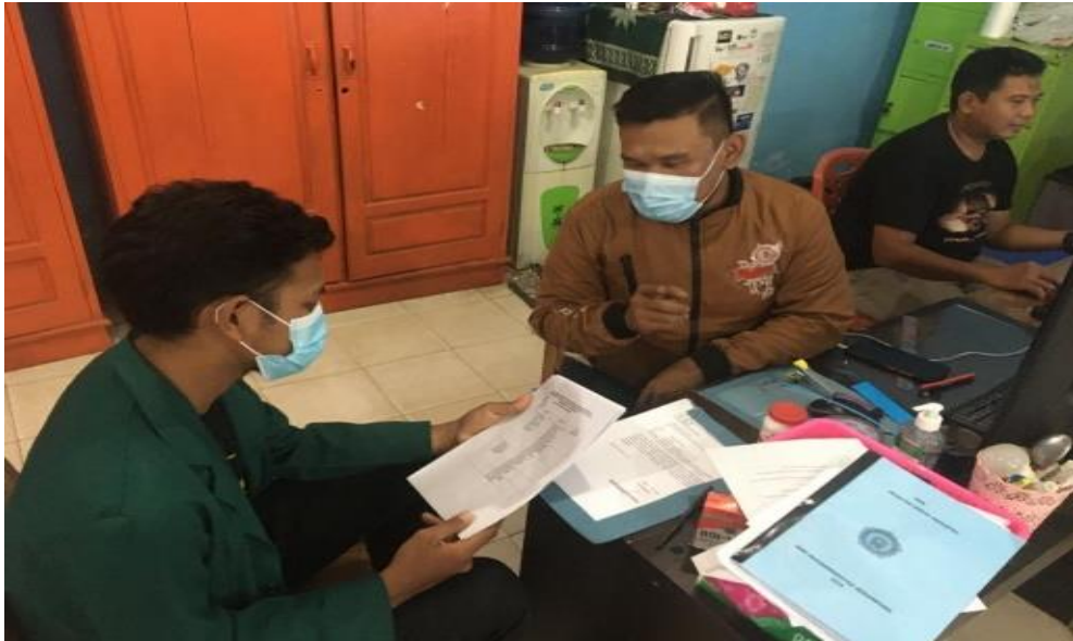
Gambar 1. Wawancara guru BK

dari catatan-catatan sekolah yang dijadikan sebagai pelengkap dalam penelitian ini. Prosedur dalam penelitian ini menggunakan metode wawancara dan observasi dalam mendapatkan data, triangulasi sumber untuk menguji keabsahan penelitian, dan menggunakan analisis data berupa model analisis data deskriptif yaitu dimulai dari mendeskripsikan sebuah fenomena, mengklasifikasikannya, lalu menganalisis keterkaitan konsep satu dengan lainnya, dan menarik kesimpulan dari konsep-konsep tersebut..