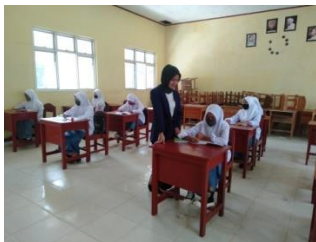
Gambar 1. Layanan ke-1

Setelah pelaksanaan pretest maka akan diberikan perlakuan pemberian layanan bimbingan klasikal terhadap konsep diri pada peserta didik. Pelaksanaan treatment untuk mengentaskan masalah konsep diri rendah yang dialami oleh peserta didik, layanan bimbingan klasikal dilaksanakan sebanyak 3 kali pertemuan dengan tujuan agar peserta didik yang mengalami masalah konsep diri rendah dapat terselesaikan dengan baik.