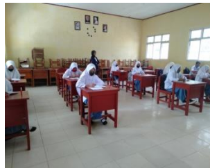
Gambar 2. Layanan ke-2