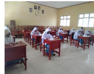
Gambar 3. Layanan ke-3