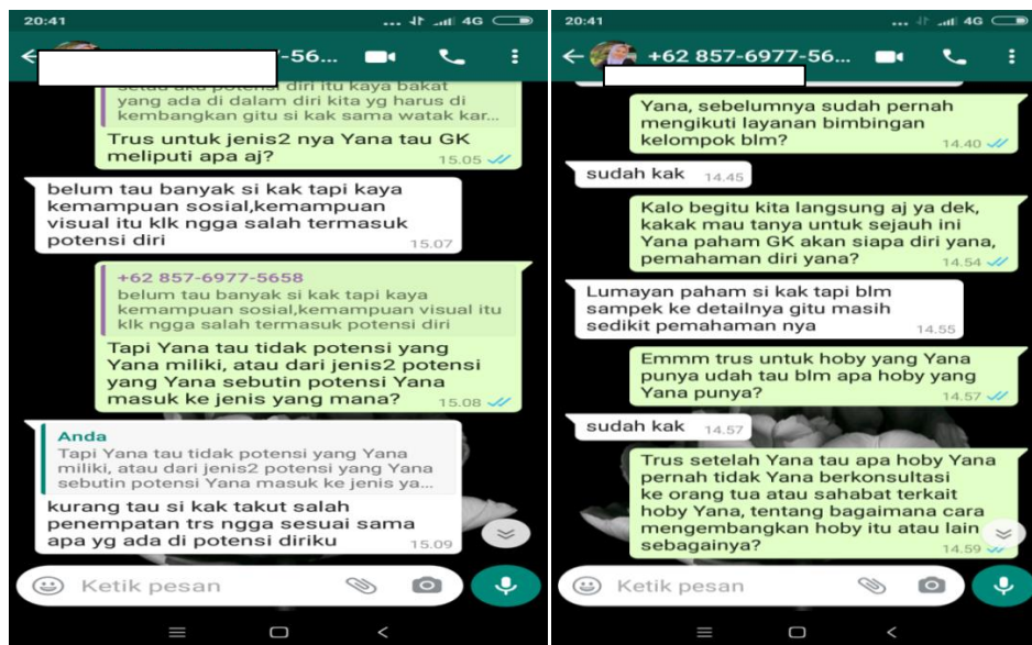
Gambar 2. wawancara via online dengan informan 2