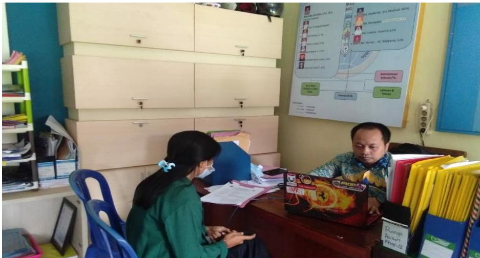
1. wawancara dengan informan 1

Sebuah temuan atau data yang didapat oleh peneliti selama dilapangan haruslah dicek keabsahannya agar dapat dipercaya dan dipertimbangkan keasliannya Moleong (2019: 372-330). Keabsahan data yang digunakan yaitu Perpanjangan keikutsertaan, triangulasi waktu, triangulasi sumber, dan juga triangulasi metodologi (wawancara dan observasi). Perpanjangan keikutsertaan peneliti mengandung arti bahwa hal tersebut mengharuskan peneliti untuk lebih lama berada dilapangan dengan tujuan untuk mendapatkan data yang lebih valid, untuk itu peneliti menggunakan triangulasi metode (wawancara dan observasi) yang bertujuan untuk mempermudah dalam proses mengumpulkan informasi yang dilakukan.