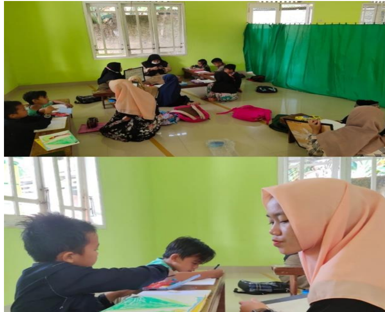
Gambar 1. Pelaksanaan layanan bimbingan Calistung

Setelah melakukan penelitian kemudian diperoleh data hasil penelitian, pada bab ini peneliti akan melakukan pembahasan lebih lanjut mengenai data hasil penelitian yang dipaparkan pada bab sebelumnya. Pembahasan data hasil penelitian mengenai pelaksanaan Bimbingan Belajar Calistung (Baca, Tulis, dan Hitung) dimasa Pandemi bagi Peserta Didik kelas I, II, dan III di SD Aisyiyah Metro Tahun Pelajaran 2021/2022.