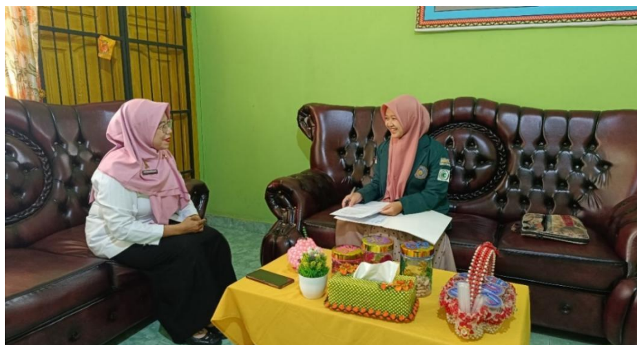
Gambar 3. Wawancara dengan Kepala Sekolah

Berdasarkan paparan tersebut, maka ditarik kesimpulan bahwasannya keterlibatan guru lain untuk membantu guru bimbingan dan konseling mengatasi tantangan dalam kurikulum merdeka yaitu membantu dengan saling berbagi ide dan pengalaman, memberikan support kegiatan satu sama lain, ikut andil dalam pelatihan, serta berkolaborasi untuk membuat metode pembelajaran yang menarik bagi peserta didik.