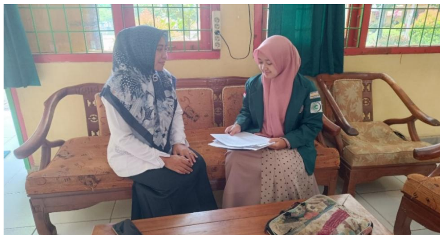
Gambar 2. Wawancara dengan Guru Wali Kelas

Berlandaskan penjelasan tersebut, kesimpulannya adalah tantangan yang dihadapi guru bimbingan dan konseling pada implementasi kurikulum merdeka di SMP Negeri 1 Punggur adalah banyak memanfaatkan media teknologi dan beradaptasi dengan hal itu. Guru bimbingan dan konseling dituntut untuk memiliki kreatifitas dan memiliki inovasi, mengalami tambahan beban kerja yang lebih banyak dari sebelumnya, kurangnya sumber daya manusia dan fasilitas pembelajaran, mengalami perubahan pola pikir lebih menarik dalam mengembangkan keterampilan siswa.