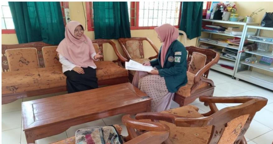
Gambar 1. Wawancara dengan Guru Bimbingan dan Konseling

“Ada beberapa strategi kurikulum merdeka yang berkaitan dengan peran guru bimbingan dan konseling seperti layanan bimbingan dan konseling dengan assesmen kompetensi minimum, kemudian ada penguatan pendidikan karakter yang bisa dilakukan dengan kolaborasi dengan guru lain, membuat rencana layanan atau program bimbingan dan konseling, kemampuan teknologi dan informasi serta ada juga pembelajaran berbasis proyek”.