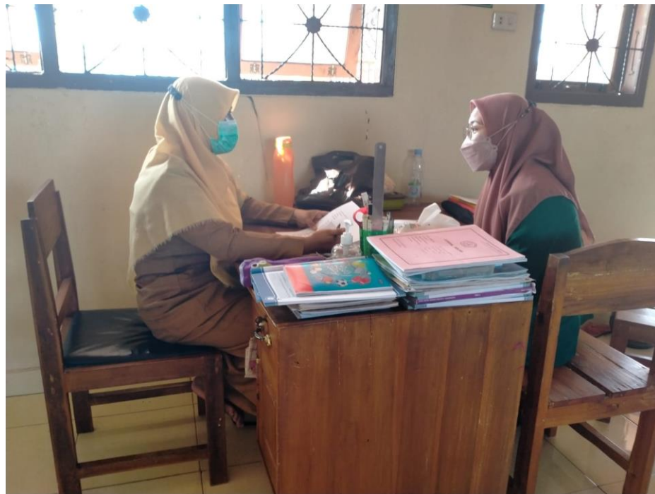
Gambar 1. Wawancara dengan Guru BK di SLB Wiyata Dharma. Beliau menceritakan tentang Konseling Individu dan Pelayanan BK di SLB Wiyata Dharma.