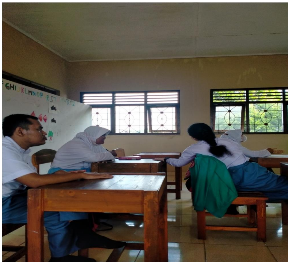
Gambar 3. Peserta Didik Sedang Belajar

Perencanaan pemberian layanan ini adalah langkah awal yang dilakukan guru untuk mengatasi masalah terkait keterampilan menulis pada peserta didik. Menulis adalah hal pokok dan pening untuk dikuasai oleh peserta didik. Belajar ataupun komunikasi membutuhkan kemampuan menulis yang baik. Perencanaan layanan bimbingan dan konseling bertujuan untuk menghasilkan rencana kegiatan yang matang agar tujuan dan hasilnya dapat optimal dan tepat sasaran. Hasil penelitian ini sejalan dengan penelitian Tohirin (2012) bahwa fungsi dari bimbingan dan konseling adaalah dalam upaya pengentasan, yaitu bertujuan untuk membantu peserta didik dalam menyelesaikan masalah yang dihadapinya dan juga Fungsi Pemeliharaan dan Pengembangan, yaitu membantu agar peserta didik berkembang sesuai dengan potensinya masing-masing.