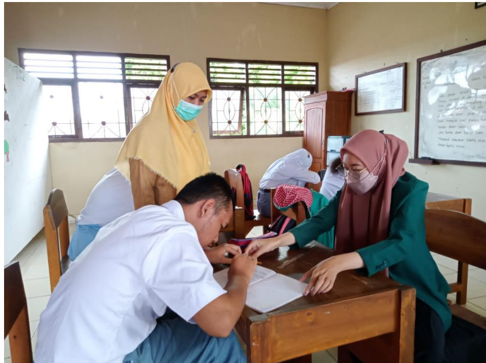
Gambar 2. Peserta Didik Belajar Menulis Huruf dan Kalimat