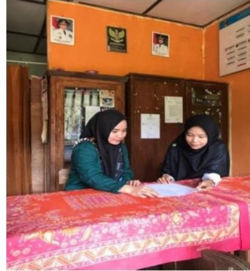
Gambar 2. Wawancara Dengan Narasumber 2