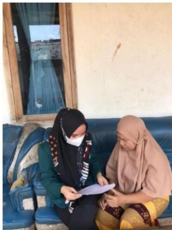
Gambar 3. Wawancara Dengan Informan 3