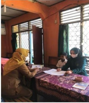
Gambar 1. Wawancara Dengan Narasumber 1