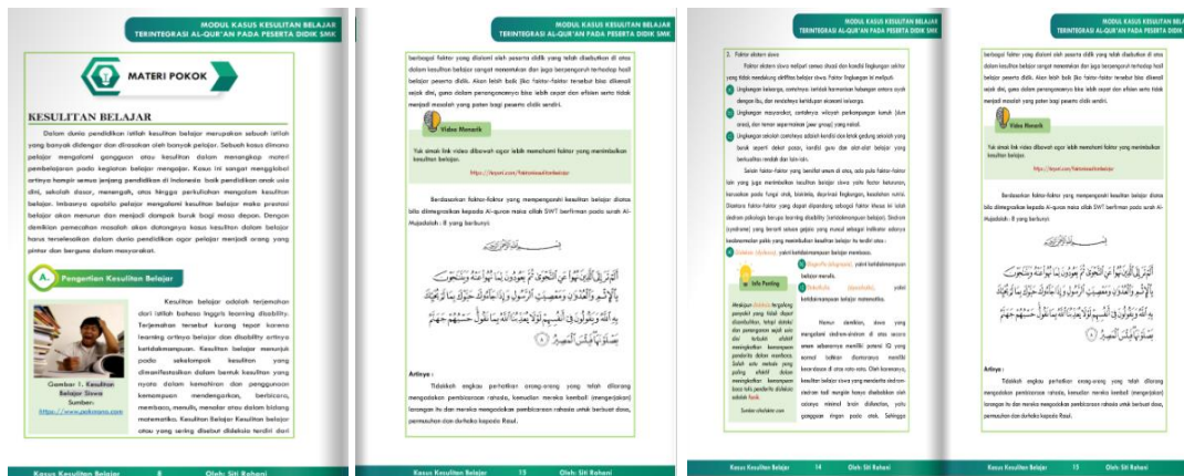
Gambar 2. E-Modul Bimbingan dan Konseling untuk kasus kesulitan belajar