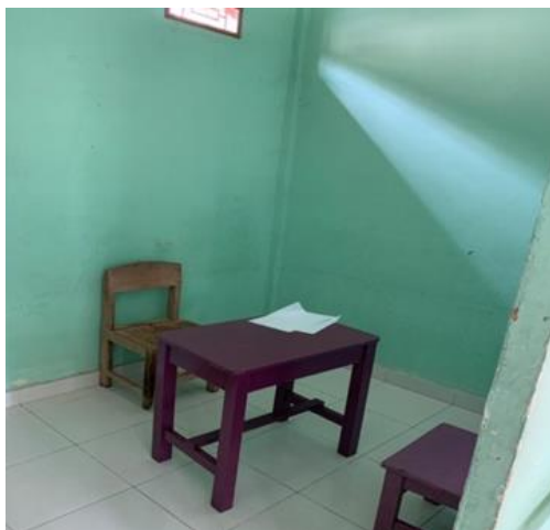
Gambar 5. Ruang 1 Terapi ABA.

Sehubungan dengan temuan penelitian diatas terkait penggunaan ruang terapi ABA. Ruang terapi yang nyaman yaitu ruang yang kedap akan suara dan mengurangi pernak pernik yang ada diruangan seperti gambar dengan warna yang mencolok bahkan kipas angin juga dapat mengganggu antensi anak. Hal ini senada dengan pendapat ahli Sari (2009:60) menjelaskan bahwa “warna aman adalah warna tidak menyilaukan. Untuk dinding sebaiknya polos atau tanpa hiasan-hiasan, dinding tembus pandang yang dapat mengganggu anak untuk melihat keluar dan merusak konsentrasi”. Penggunaan ruang terapi harus menghindari warna yang dapat mengganggu konstansi anak seperti warna terlalu terang dan dinding ruang terapi sebaiknya kosong tidak ada benda yang menempel.