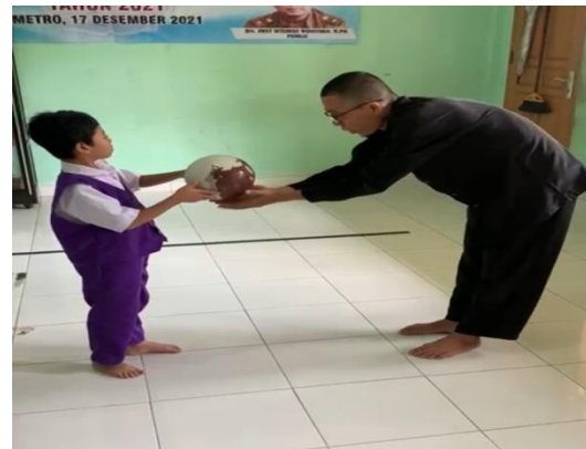
Gambar 2. Pemberian instruksi oleh terapis

Hasil penerapan metode ABA yang telah dilakukan di SLB Insan Madani mampu membantu anak lebih mandiri dalam hal membina diri anak tersebut yaitu O, K, H dan D. Ke empat anak tersebut sudah mampu melakukan aktivitas bina diri dengan baik. Pernyataan ini membuktikan bahwa pelaksanaan metode ABA yang diterapkan SLB Insan Madani Metro efektif membantu anak ASD dalam mengembangkan kemampuan bina diri sehingga