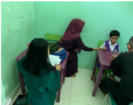
Gambar 1. Pelaksanaan terapi ABA

Pelaksanaan metode ABA yang diterapkan di SLB Insan Madani Metro menggunakan teknik Discrete Trial Training yang mana terapis mengalami kegiatan dengan melakukan kontak mata kepada anak. Kontak mata diberikan dengan memanggil nama anak kemudian dilanjutkan diberikan instruksi atau sebuah perintah dan jika anak tidak mau merespon atau tidak mampu melakukan maka diberikan promt atau bantuan. Setelah diberikan bantuan anak merespon dengan baik atau respon yang ditunjukkan salah maka diberikan tanda atau feedback sebuah tanda respon benar dan sebuah hukuman riangan. Selanjutnya ketika anak merespon instruksi dengan baik dan benar maka diberikan penghargaan atau reinforcement .