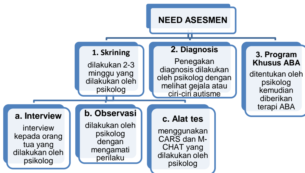
Bagan 1. Perencanaan Metode Applied Behavior Analysis SLB Insan Madani Metro.

Perencanaan metode ABA yang dilakukan di SLB Insan Madani Metro yaitu dengan need-asesment yang dilakukan oleh psikolog. Need-asesment dengan melakukan skrining atau pengumpulan data selama 2-3 minggu dengan melakukan interview kepada orang tua anak, melakukan observasi kepada anak dengan mengamati perilaku keseluruhan anak kemudian dibantu dengan alat tes pendeteksi gangguan autis pada anak yaitu dengan CARS dan M-CHAT. Setelah itu dilakukan penegakan diagnosis apakah anak tersebut mengalami autis ringan, sedang atau berat kemudian setelah itu diberikan program khusus yaitu ABA sesuai dengan kebutuhan yang dialami anak.