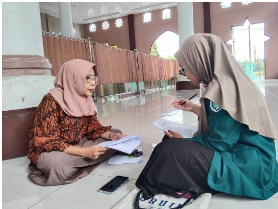
Gambar 1. Wawancara dengan guru BK

Berdasarkan uraian diatas dapat disimpulkan bahwa data primer merupakan data yang didapatkan secara langsung dari subyek yang dalam penelitian ini subyeknya adalah guru BK di SMP Negeri 1 Metro. Dan data sekunder merupakan data yang didapatkan secara tidak langsung melalui dokumen atau bahan-bahan yang berhubungan dengan pelaksanaan BK yang dalam penelitian ini berarti program semester atau program tahunan guru BK dan dokumen-dokumen penunjang lainnya.