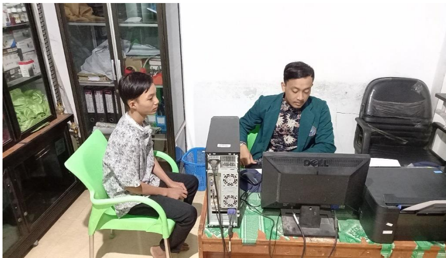
Gambar 1. Proses Wawancara Dengan Narasumber Korban Perilaku Ghasab

Barang yang diambil adalah barang yang sering digunakan oleh para santri, kejadian ghasab terjadi pada sore hari di lingkungan asrama pondok pesantren, dan saat itu ketika akan pergi ke masjid untuk melaksanakan Sholat. Barang yang diambil oleh MS akan digunakan seperti halnya barang itu milik pribadi dirinya tanpa memikirkan persaan pemilik asli barang tersebut. Diketahui bahwa MS mengambil barang itu hanya bertujuan untuk memanfaatkan fungsi dari barang tersebut, sesuai dengan kebutuhannya saat itu saja bukan bertujuan untuk menjadikan barang yang diambilnya menjadi miliknya. MS akan mengembalikan barang yang diambilnya pada tempatnya jika saat itu keadaan memungkinkan dan akan dibiarkan begitu saja jika keadaan tidak kondusif. Sebagaimana yang dipaparkan oleh ustadz bagian kesartrian bahwa “barang yang diambilnya akan digunakan layaknya barang miliknya, tanpa memikirkan bagaimana dengan pemilik aslinya, MS mengambil barang sesuai dengan kebutuhannya saat itu, ketika sudah tidak dibutuhkan maka akan ditinggalkan atau juga ditaruh kembali di tempat awal dia mengambil.”