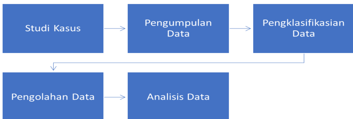
Gambar 1. Diagram Alur Penelitian

Metode penelitian yang digunakan dalam penelitian ini adalah dengan pendekatan kualitatif. Dalam pengumpulan data penelitian, penulis menggunakan teknik studi kasus. Langkah ini dilakukan dengan cara mencari fenomena-fenomena kebahasaan yang terkait dengan permasalahan literasi membaca dan penggunaan kamus. Berikut ini merupakan tahapan penelitian dalam bentuk diagram alir metodologi penelitian.