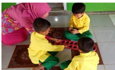
Gambar.3 Kegiatan Kerja sama siswa

Karakter toleransi, anak-anak suku Lampung mengalami peningkatan yang sangat baik setelah mendapatkan pendidikan multikultural. Presentase perubahan karakter toleransi mereka meningkat dari 40% menjadi 80%. Namun, anak-anak suku Banten mengalami peningkatan yang lebih rendah, yaitu dari 40% menjadi 60%. Anak-anak suku Lampung sebelumnya kesulitan dalam menerima perbedaan budaya, sedangkan anak-anak suku Banten masih membutuhkan pemahaman lebih dalam mengenai pentingnya menghormati perbedaan budaya dan agama. Perbedaan hasil ini dipengaruhi oleh faktor lingkungan dan pengalaman masa lalu.