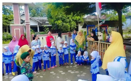
Gambar 1.Upacara Bendera

Tahap pertama adalah tahap pembiasaan, dimana peserta didik diajarkan untuk membiasakan diri dengan kegiatan sehari-hari, seperti upacara bendera, memberi salam kepada guru, dan menjaga kebersihan diri. Kegiatan ini bertujuan untuk membentuk karakter disiplin, cinta tanah air, dan kepedulian terhadap kebersihan.